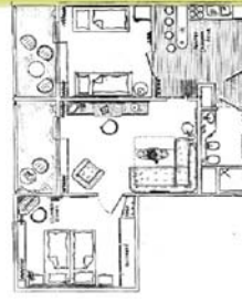
Appartementtyp IV ca. 58 m 2