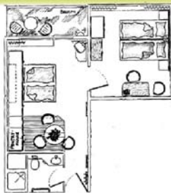
Appartementtyp III ca. 36 m 2