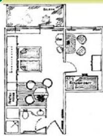
Appartementtyp II ca. 32 m 2