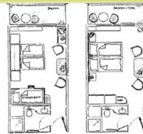
Typ Family ca. 22 m 2 Typ Business ca. 22 m 2